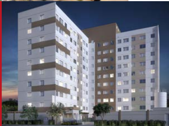
São Paulo: ForLife Freguesia | 144 unidades