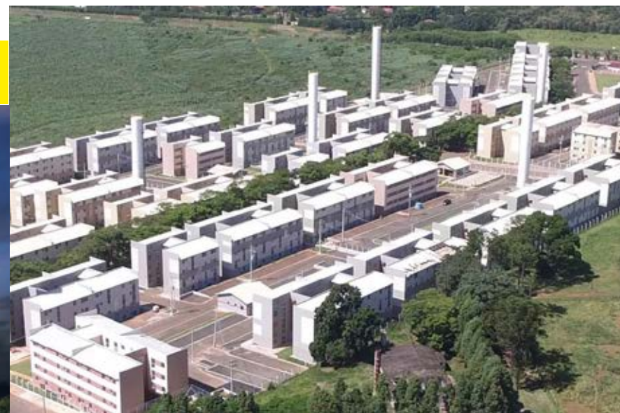
Sorocaba: Residencial Jardim Carandá | 2.560 unidades