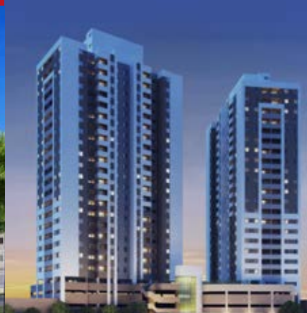
São Paulo: Up Life | 339 unidades