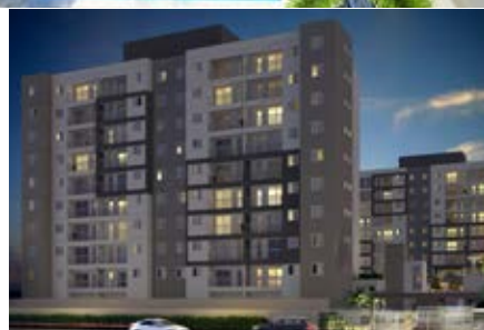
São Paulo: Moob | 229 unidades