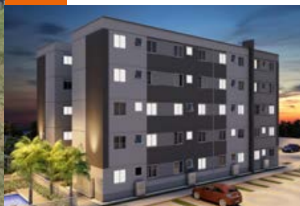
Hortolândia: ForLife Tulipas Clube | 160 unidades