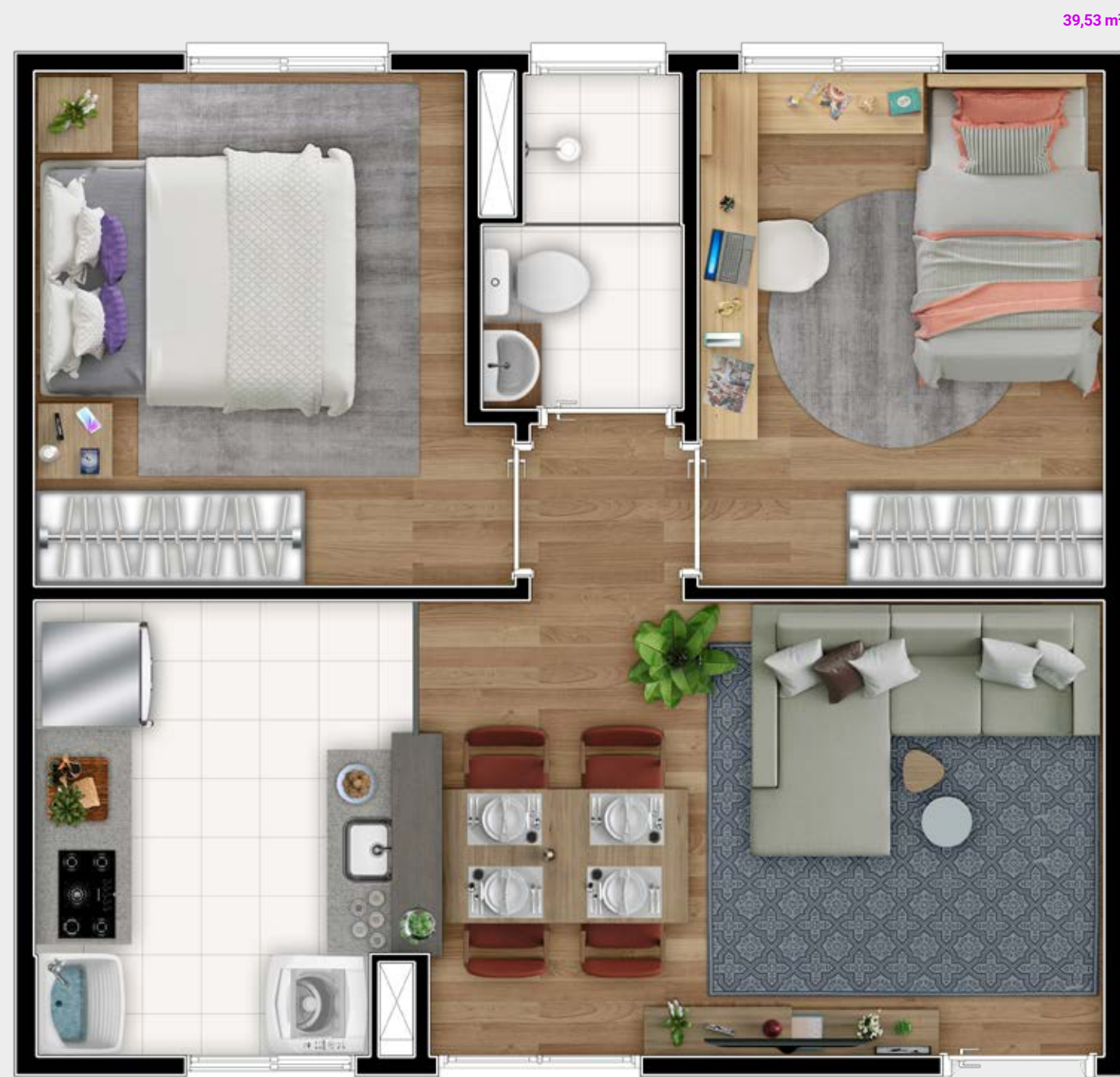
Ilustração artística da planta com sugestão de decoração. Os móveis, utensílios, adornos e equipamentos não fazem parte do contrato de venda e compra. Acabamentos e revestimentos serão entregues conforme memorial descritivo específico. Esta planta poderá sofrer variações decorrentes do atendimento de postura de órgãos públicos e concessionárias. Imagem meramente ilustrativa.

Apartamentos modernos e projetados para você criar o seu ambiente ideal de modo prático e funcional.