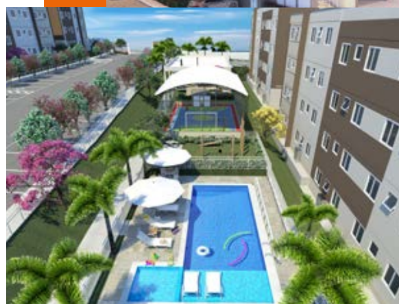
Catanduva: ForLife Buriti Clube | 272 unidades