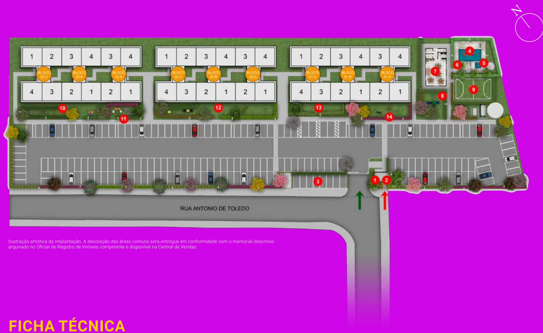
Ilustração artística da Implantação. A decoração das áreas comuns será entregue em conformidade com o memorial descritivo arquivado no Oficial de Registro de Imóveis competente e disponível na Central de Vendas.

Desfrute da melhor estrutura para você viver bem.