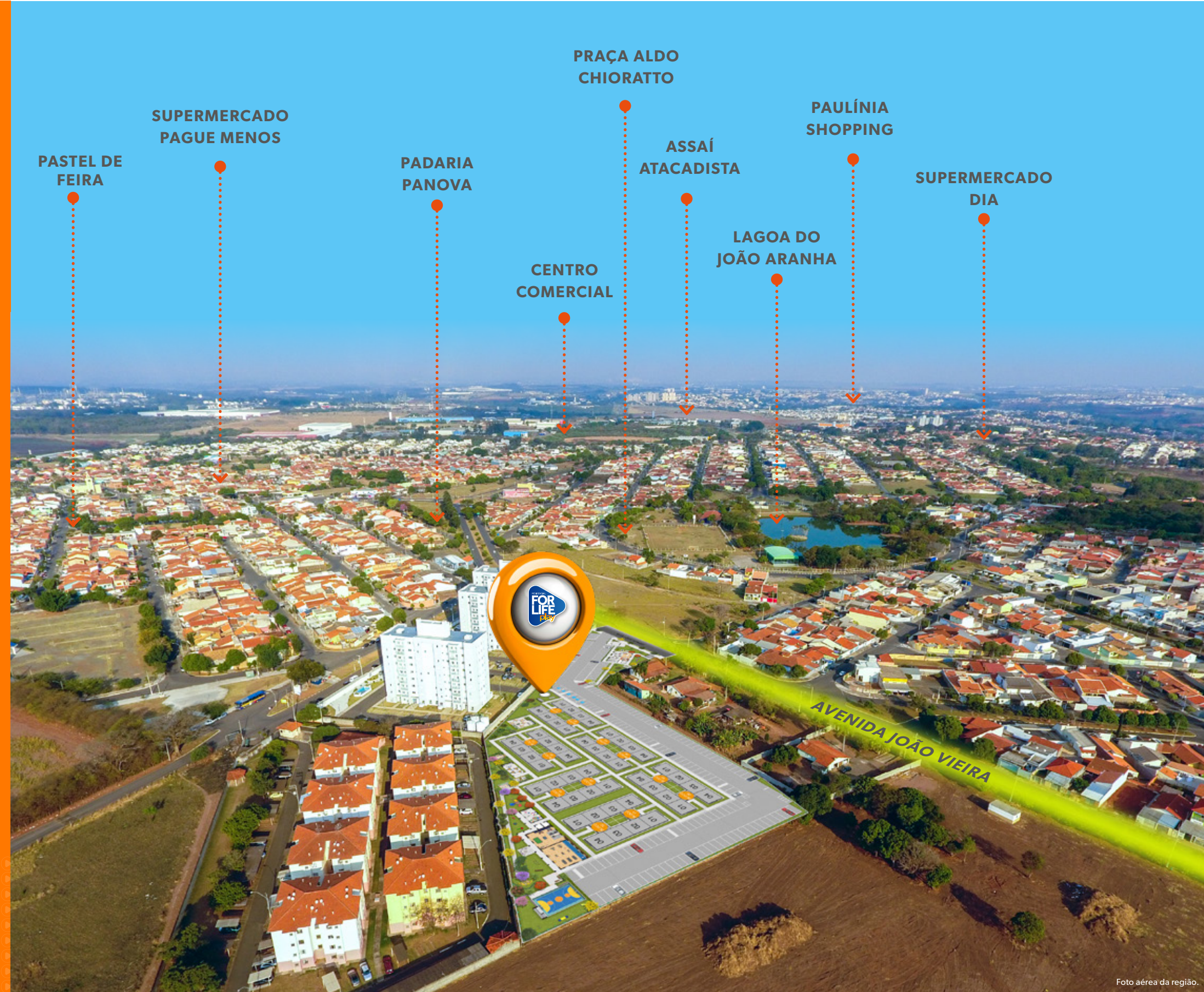
Foto aérea da região.