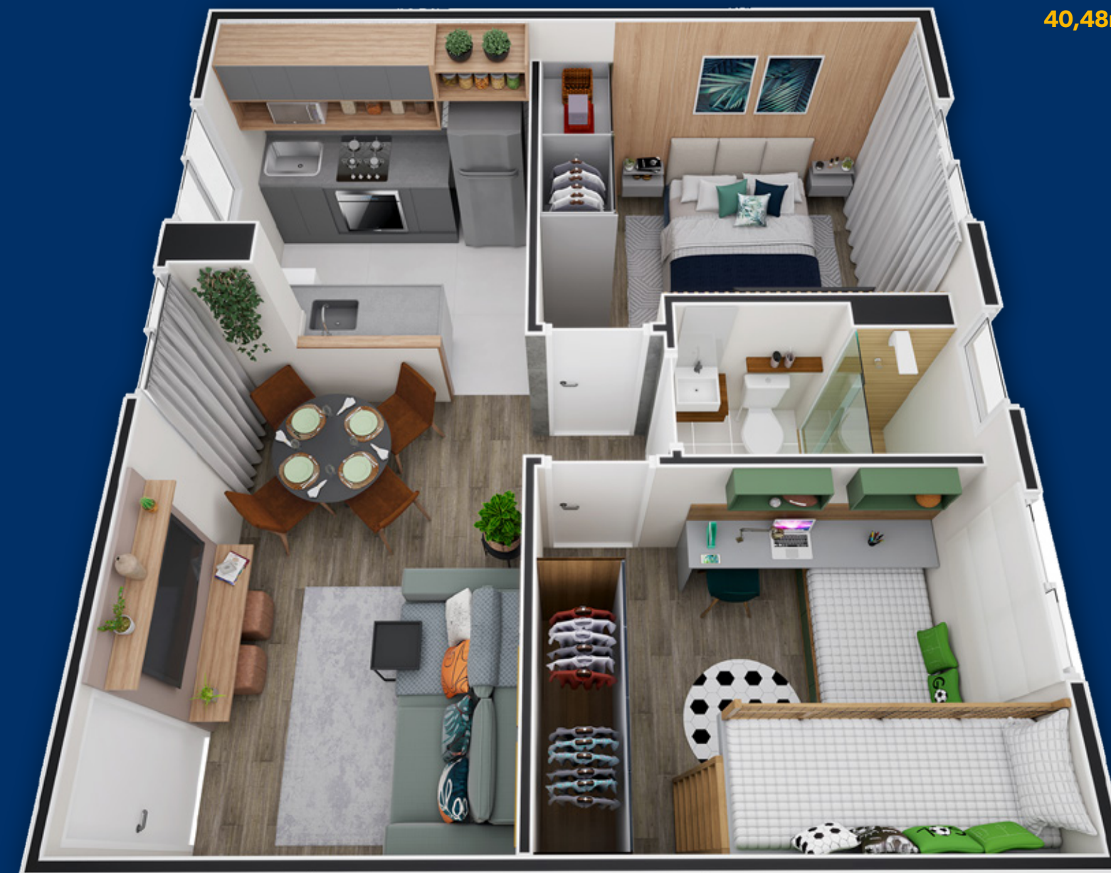
Ilustração artística da planta com sugestão de decoração. Os móveis, utensílios, adornos e equipamentos não fazem parte do contrato de venda e compra. Acabamentos e revestimentos serão entregues conforme memorial descritivo específico. Esta planta poderá sofrer variações decorrentes do atendimento de posturas de órgãos públicos e concessionárias.